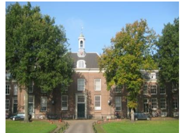
Evangelische Broedergemeente Zeist

Ook in Nederland bestaat een bloeiende Evangelische Broedergemeente, die vanuit Zeist opereert. Maar waar komen deze Hernhutters vandaan? Wie de hedendaagse Broedergemeente van Zeist wil leren kennen en begrijpen, moet teruggaan in het verleden want deze protestantse geloofsgemeenschap leeft vanuit haar bijzondere historie. De wortels van de Broedergemeente reiken tot in het begin van de 15e eeuw. In het Tsjechische Bohemen en Moravie ontstond toen een hervormingsbeweging onder leiding van Johannes Hus. Hij preekte in de landstaal, had bezwaren tegen de Mariaverering en de zelfverrijking van de rooms katholieke kerk. Hiervoor werd hij op de brandstapel ter dood gebracht. Dit leidde tot een bloedige oorlog.